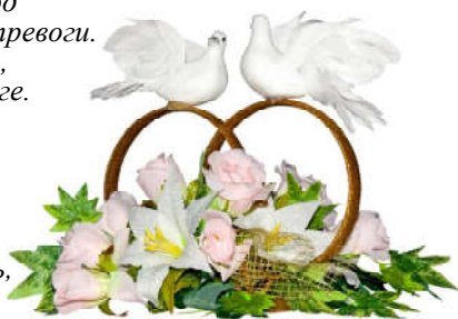
Дети и внуки Чаусовы.

Прожили вместе не один вы год Все было в жизни – радости, тревоги. Морщинки появились от забот, Но вы шагали дружно по дороге. Любовь, уважение, признание Заслужены честным трудом, О долге вы помнили прежде, О личных удобствах потом. Вы неразлучны полвека. Наш долг – от души пожелать, Чтоб солнце луна и все звезды Для вас продолжали сиять!